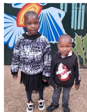
Im NEST !!

Während der 1. Gerichtsverhandlung waren die Kinder so voller Angst als sie die Eltern nur von weitem sahen, dass sie kein Wort sprechen konnten, sondern nur laut schrien. Zumindest wurde die Anklage festgestellt und nun sind beide Eltern in Untersuchungshaft. Einen Termin für die Hauptverhandlung steht noch nicht fest. Eigentlich ist ja auch die Mutter ein Opfer von häuslicher Gewalt, sie konnte die Kinder gar nicht beschützen.